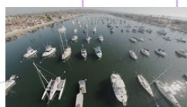
ロサンゼルス (ドローン空撮有)