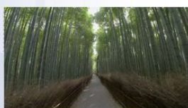
京都 (ドローン空撮有)