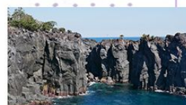
伊豆・成田 (ドローン空撮有)