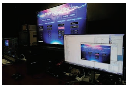
東京オフィスのオーサリング工程

パナソニック映像㈱が、今春から「ディスクサービス」を強化している。パナソニックグループにおいて、パナソニック AVC ディスクサービスで提供していた技術・サービスを統合させ、新たに東京・品川区にある東京オフィス内に「エンコード工程」「オーサリング工程」、高画質フォーマット「MGVC」に対応する「視聴室」を再整備し、「ディスクサービス」に関する全てが社内揃う体制を整えた。同社は映像に関するあらゆる事業を展開しており、メイン事業である「映像コンテンツ事業」のほか、最近ではリアル・バーチャルイベント／VR等の「空間演出事業」に注力してきたが、コロナ時代にも堅調な需要があり、特に「特別な作品は手元に置きたい」という“プレミアム感”を求める根強いコアユーザーを有するディスクメディアに着目、ポストプロや撮影を展開する「テクニカルサービス」にディスクサービス・オーサリングチームを立ち上げ、UltraHD ブルーレイ／DVD などハイエンド作品をはじめとする「ディスクサービス」に注力する。代表的な事例として「宮崎駿監督作品集」(ウォルト・ディズニー・ジャパン)、「水曜どうでしょう DVD シリーズ」(北海道テレビ放送)、「ULTRAMAN ARCHIVES ウルトラQ UHD & Movie NEX」(円谷プロダクション)、「宝塚歌劇 BD/DVD」(宝塚クリエイティブアーツ)などがある。